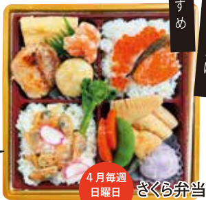
お花見弁当に おすすめ